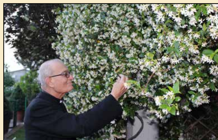
Ogni Briciola è un fiore dato con amore

40° anniversario AIDO Montichiari RICORDO DI DON LUIGI LUSSIGNOLI Primo anniversario 18 marzo 2018