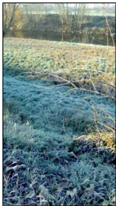
La magia del Chiese.

P aesaggio lunare, quasi magico, in dicembre, lungo il Chiese. La brina notturna ha trasformato le rive del fiume in una distesa candida, quasi fosse coperta da una lieve spruzzata di neve, pur non essendo ancora arrivata. Soprattutto la riva più a nord, è rimasta con questo aspetto fino a tardi, quando il tiepido sole l'ha raggiunta e pian piano ha fatto evaporare la brina. Il silenzio sembra ancora più profondo, un'apparente scenario addormentato si staglia fino oltre il fiume, mentre l'acqua scorre silenziosa, adagio, forse anch'essa rallentata dal gelo di una notte dalla temperatura rigida. Poche le persone a passeggio, tranne qualche temera-