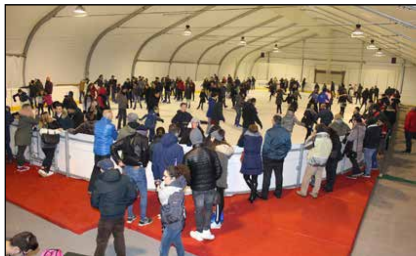
Il Palaghiaccio preso d'assalto nelle festività appena trascorse.

I l Palaghiaccio a Montichiari, ogni anno che passa, trova un consenso maggiore fra i moltissimi appassionati di questo sport-divertimento. Nei giorni appena trascorsi, grazie alla festività si è registrata una presenza record che premia gli organizzatori del loro costante sforzo per rendere sempre più interessante questa disciplina invernale. La fotografia non rende del tutto merito alle presenze così numerose da impegnare non poco l'organizzazione soprattutto con la diabolica rasaghiaccio, elemento impor-