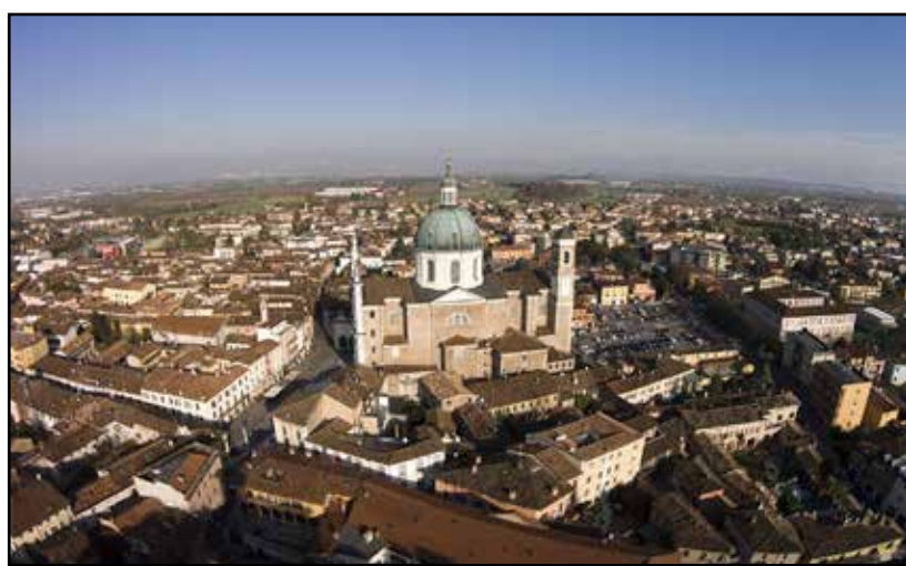
Il centro storico della Città di Montichiari.

menti pedonali in sicurezza (in particolare nella zona Scoler, area a forte espansione, e in località Santellone)