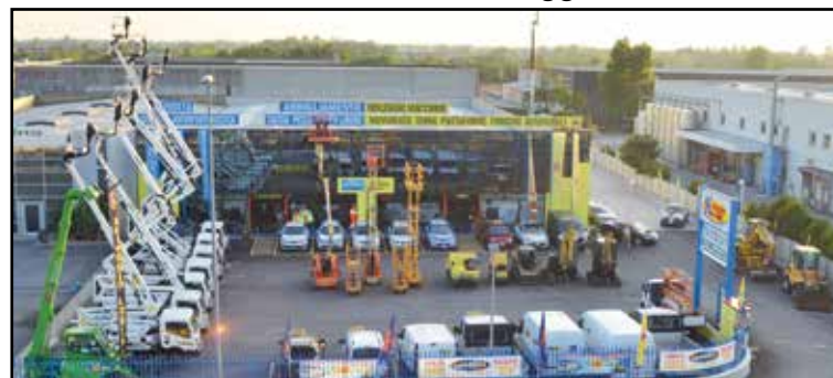
La nuova sede della Noleggio Lorini in zona industriale, via E. Montale 15.

SEDE: MONTICHIARI (BS) - Via E. Montale, 15 FILIALI: CALCINATO - CASTEGNATO tel. 030.9650556 - www.noleggiolorini.com