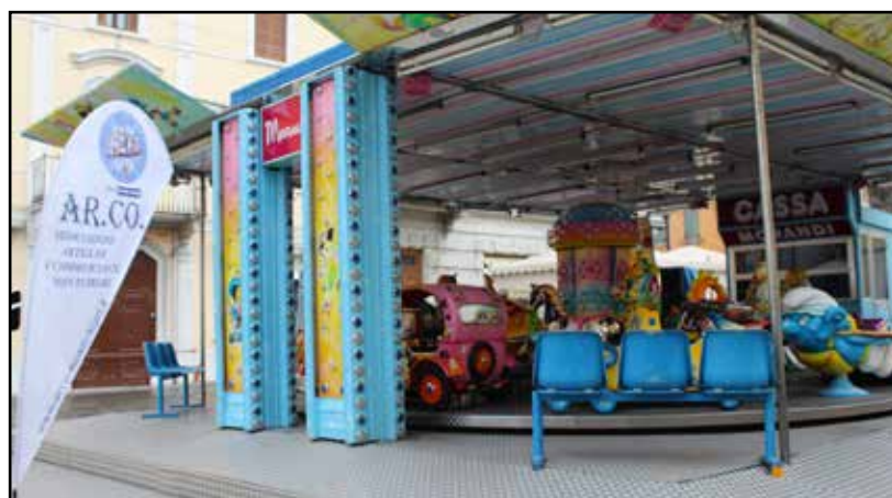
La giostra in Piazza S. Maria a cura dell'AR.CO.

Sono stati distribuiti oltre 4000 biglietti omaggio da parte dei componenti l'Associazione per gratificare i loro clienti e per la gioia di molti bambini che si sono divertiti in questi giorni di festa.